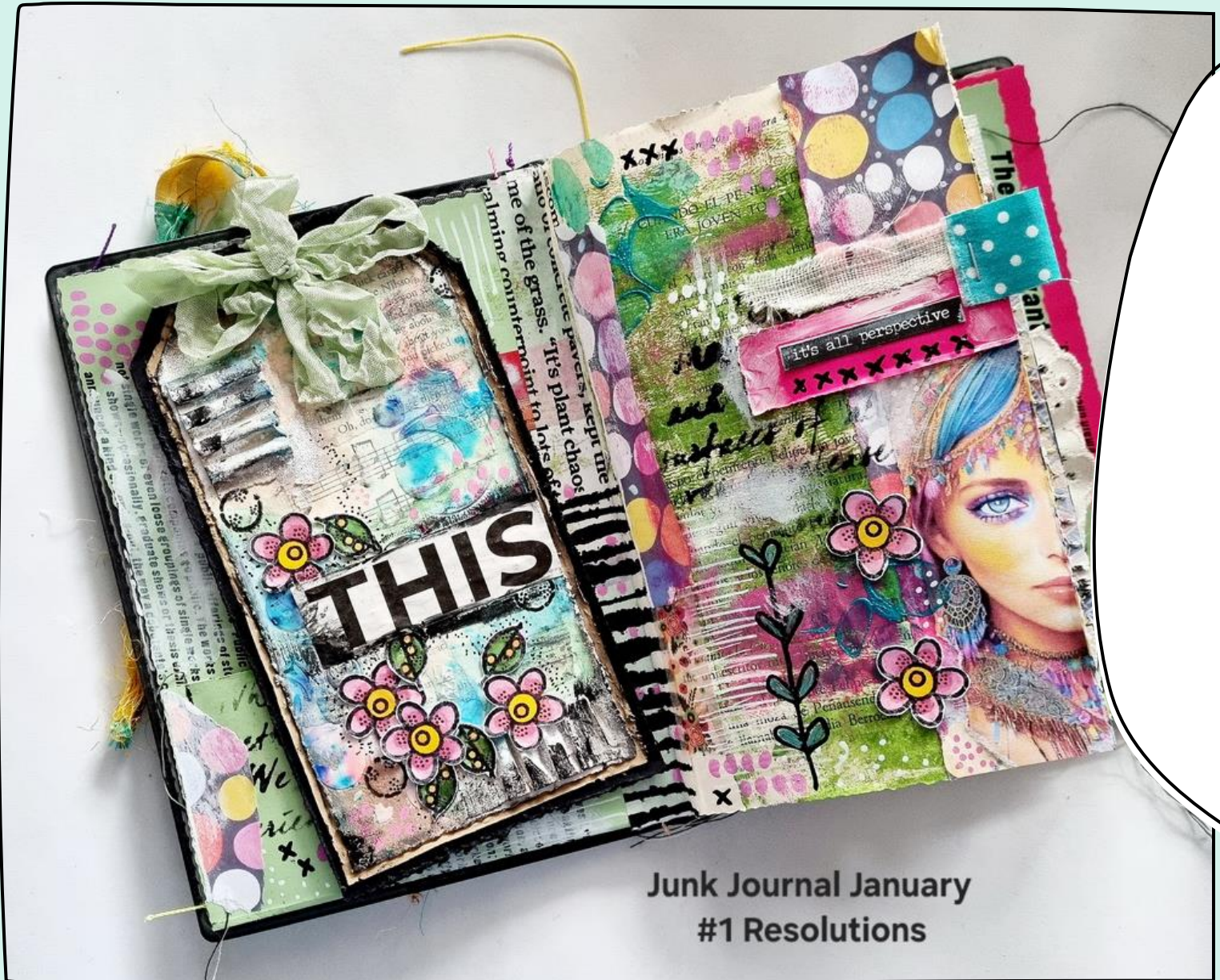
Junk Journal January #1 Resolutions